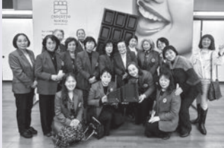
大きなチョコのかげらを持って 記念撮影