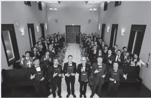
志を胸に、小山 YEG One Team!!

3月6日(金)、令和7年度の卒業式を執り行いました。昨年に引き続き、例会の一環としての開催となり、今年度は卒業生6名にご出席いただきました。 これまで青年部を支えてこられた卒業生の皆様へ、在籍中のご尽力に対する感謝の意をお伝えするとともに、卒業生からは現役メンバーに向けて、ご自身の経験を踏まえた温かい激励の言葉が贈られました。